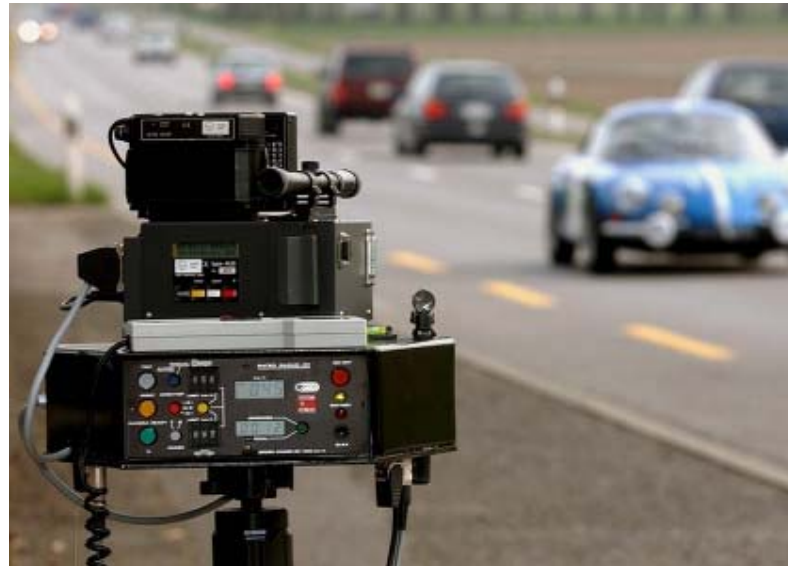
Un radar aura été fatal au policier fribourgeois à moto

• Ces vitesses sont les plus élevées enregistrées par la police fribourgeoise depuis 1994.